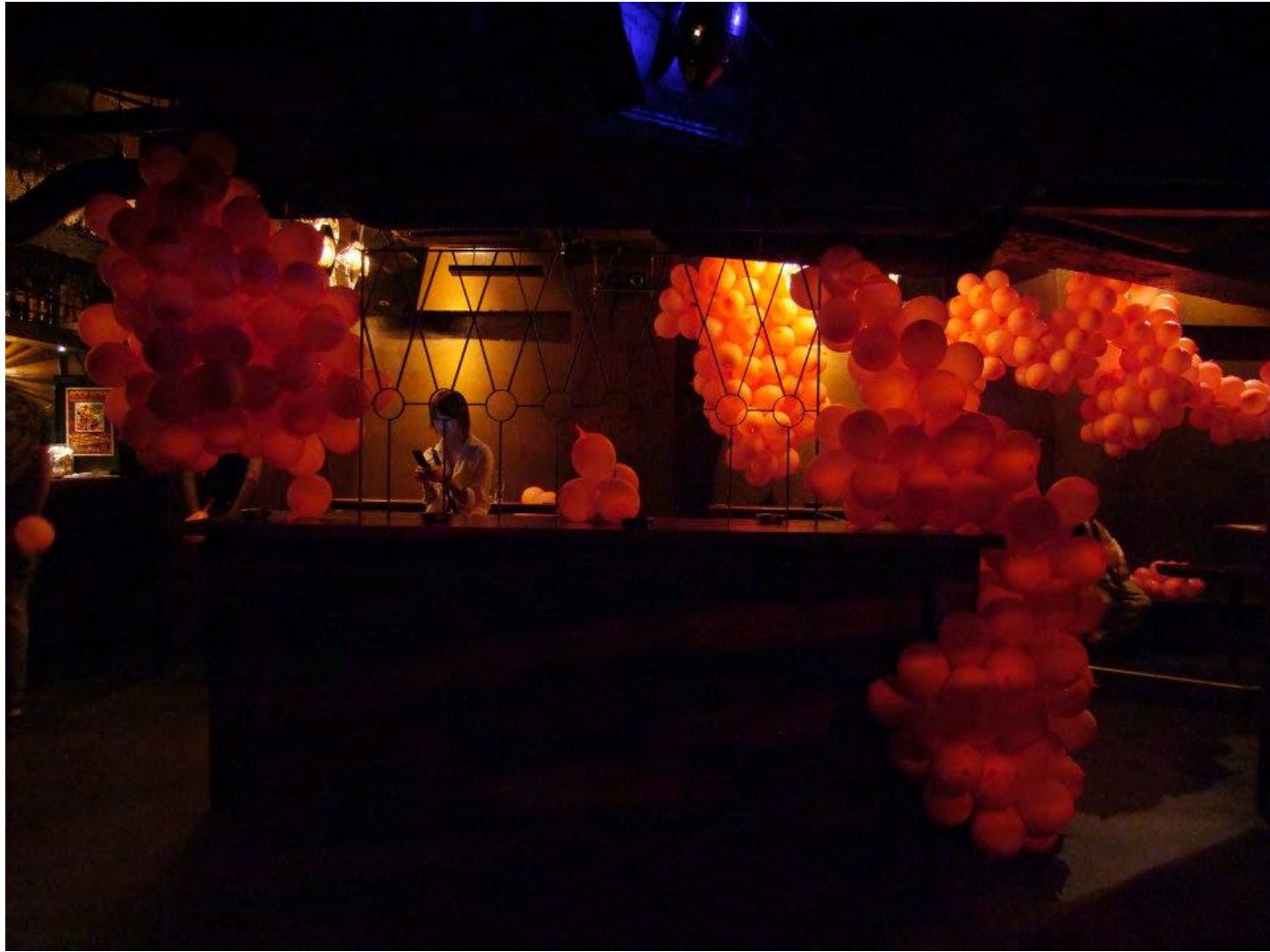
空間インスタレーション 2010年9月 渋谷ROOM ゆらぎイベント