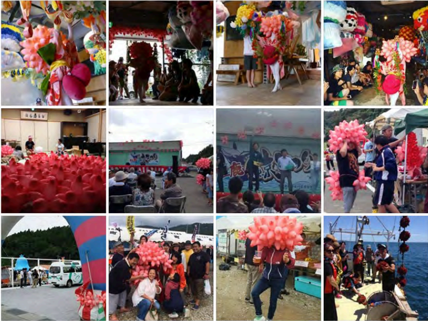
HOYAPAI 2016 STAND UP WEEK2016「織姫の舞」、くじら祭り@牡鹿半島 鮎川浜