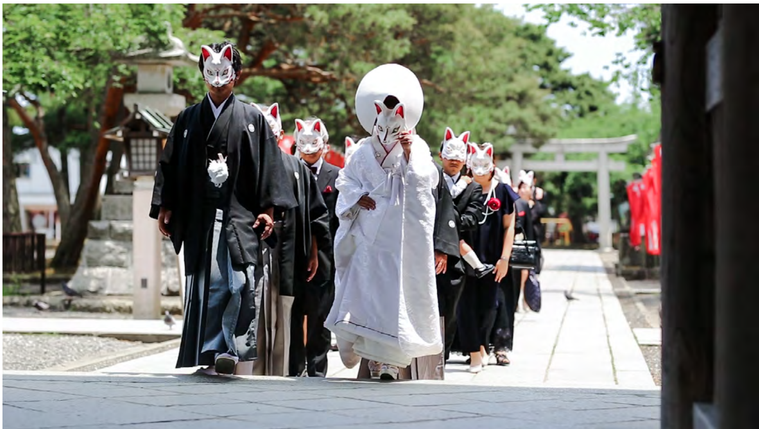
2017年6月 婚礼企画「狐の嫁入り」 @石巻／牡鹿半島