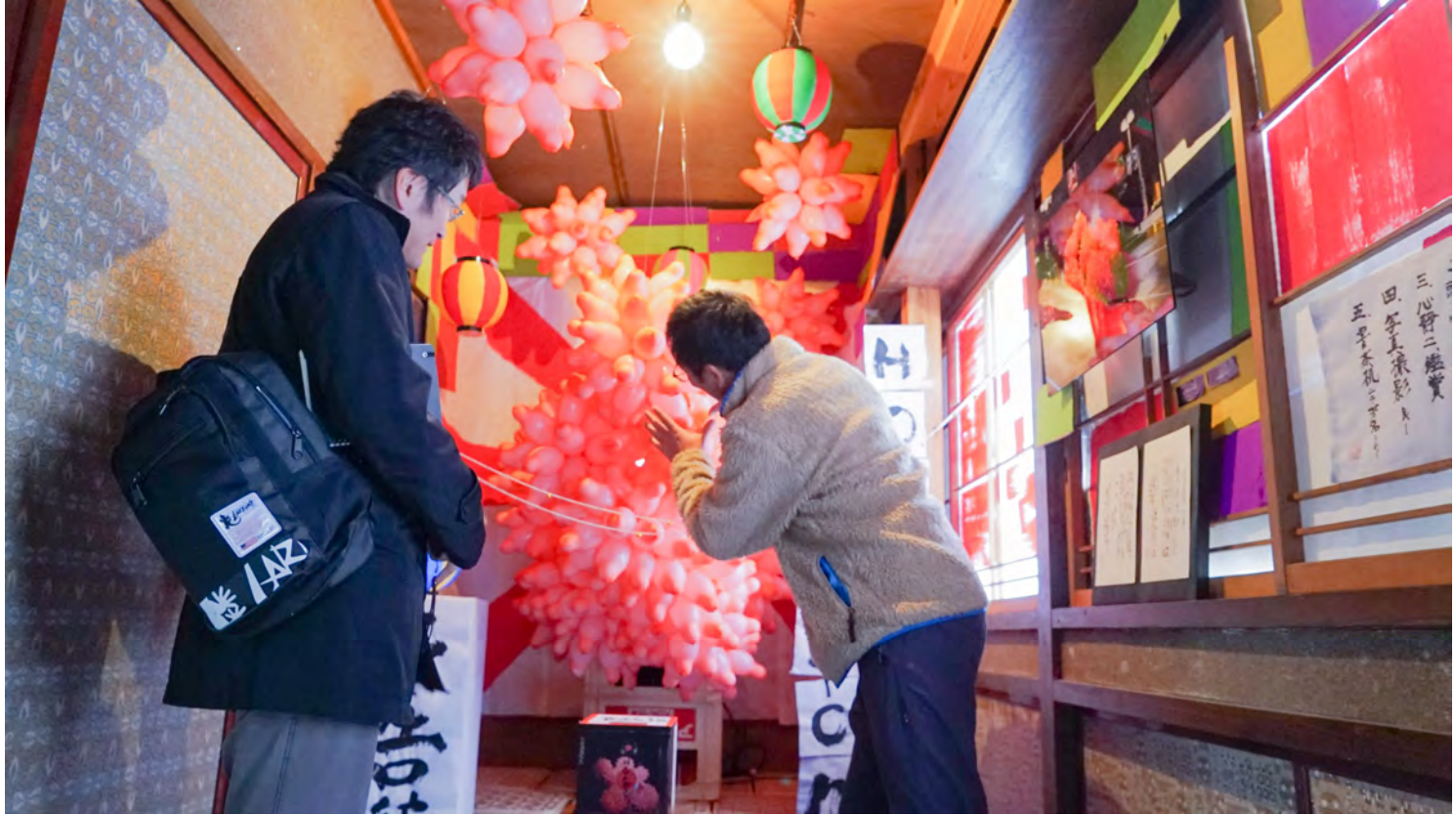
2019. 2 仏凱旋展覧会 予告編 石巻のキワマリ荘 マニマニ露店@石巻