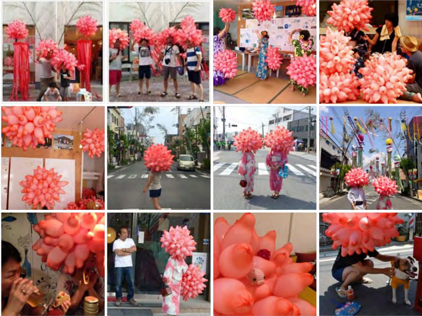
HOYAPAI 2015 STAND UP WEEK2015、川開き祭